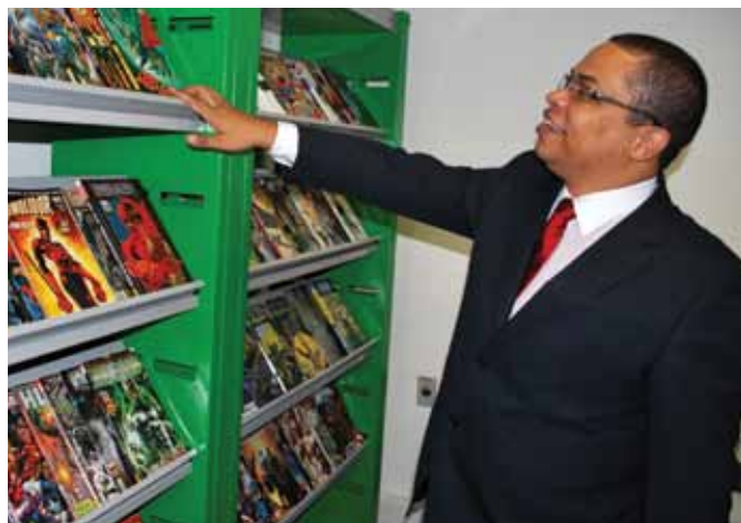
O administrador exhibe sua coleção de gibis.

Adoro ler! Pra ser sincero coleciono gibis (risos). Sei que parece infantil, mas eu adoro. Tenho mais de 2.000 exemplares em casa.